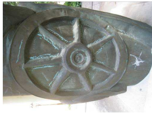
2. Komtragédia emlékmű