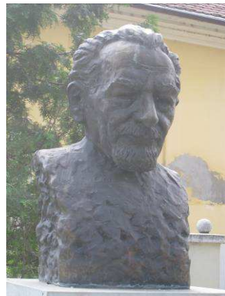
6. Pákolitz István szobra múzeum udvara