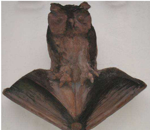
3. Városi könyvtár