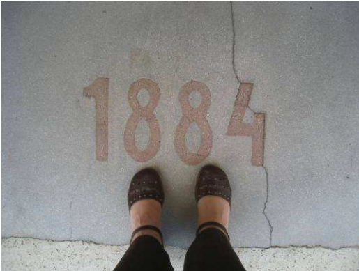
1. Evangélikus templom bejárata