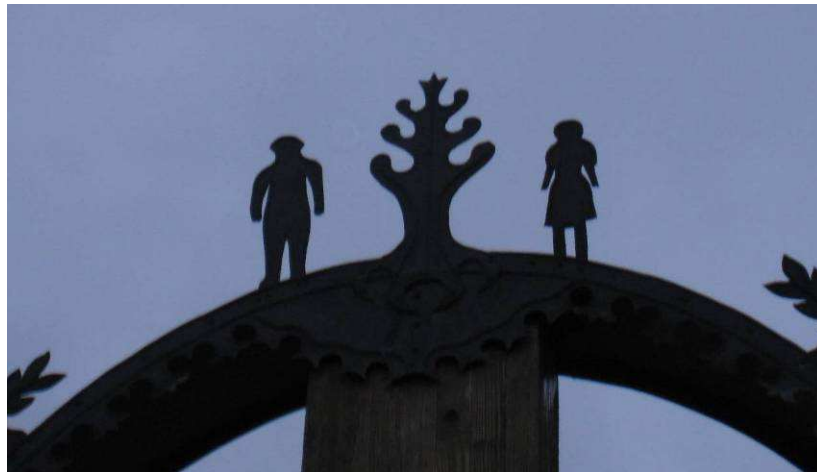
13. Makovecz-templom mögött (Életfa)