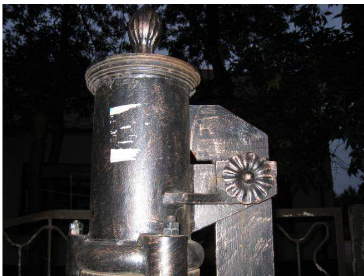
7. Dózsa Gy. út – Rákóczi u. sarok, gyógyszertár